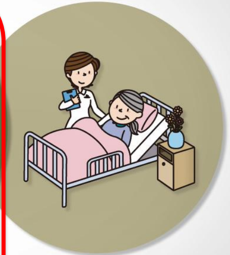
二次救命処置と 心拍再開後の集中治療